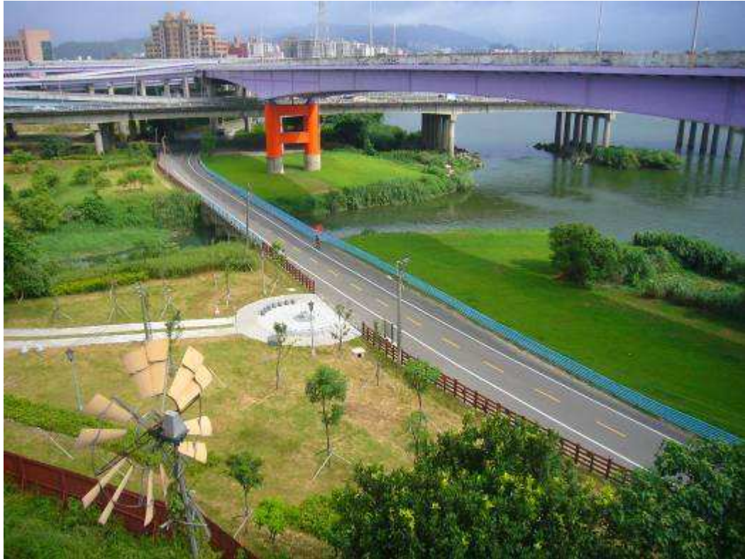
寶藏巖臨淡水河面景觀