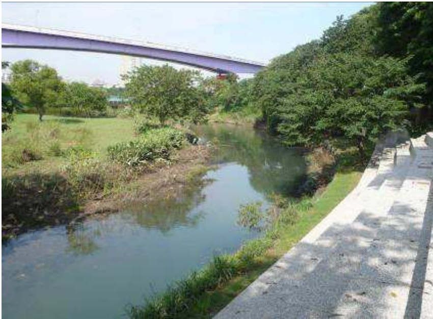
寶藏巖寺前方萬盛溪